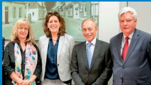
HET COLLEGE VAN B&W

In de begroting van de gemeente gaat veel geld om. Ieder jaar stelt de gemeenteraad de begroting voor de komende jaren vast. In die begroting staat welke inkomsten we verwachten en waaraan we dat geld uitgeven. In dit overzicht staat de begroting in één oogopslag. De volledige begroting vindt u op https://nieuwkoop.begroting-2020.nl .